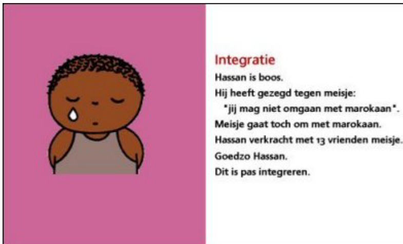
Voorbeeld van de Bruna-spam.

Ook de discriminerende plaatjes gemaakt in de stijl van de tekenaar Dick Bruna werden op grote schaal rondgezonden en op webpagina's en webfora geplaatst. Het Meldpunt heeft zoveel mogelijk van deze uitingen laten verwijderen en Dick Bruna (via zijn uitgever) op de hoogte gesteld van deze copyright schendingen.