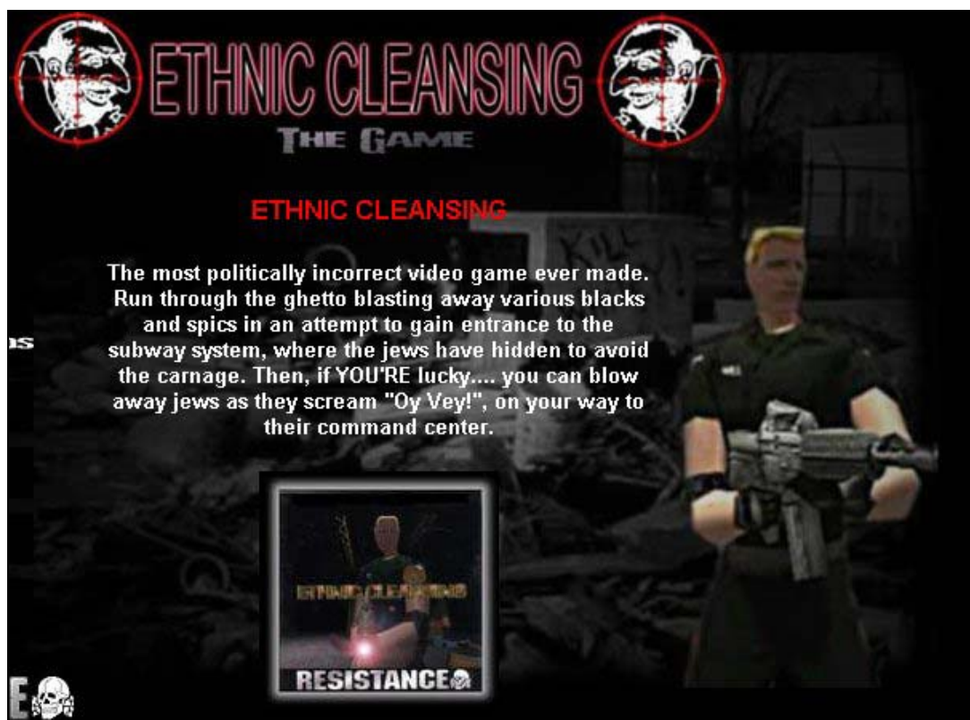
Voorbeeld van een racistisch spel dat op Internet wordt aangeboden

Zoals gezegd zijn Islamofobie/Moslimhaat (607 uitingen) en Antisemitisme (584 uitingen waarvan 51 holocaust ontkenning) momenteel de hoofdgronden voor discriminatie op Internet. Op de 2 e plaats staat discriminatie op basis van 'andere afkomst of nationaliteit' (243 gemelde uitingen) dat vooral gelezen moet worden als 'generieke uitingen gericht tegen buitenlanders, allochtonen en migranten'. Een stijger is Seksuele Voorkeur (Homohaat), vorig jaar nog op 39, nu op 80 uitingen. De meeste van deze anti-homo uitingen stonden op Moslim-webfora. Discriminatie tegen mensen van Surinaamse, Antilliaanse of Afrikaanse afkomst (anti-zwart racisme) komt op het Nederlandse gedeelte van Internet nauwelijks voor. In totaal werden hierover 36 uitingen gemeld. Ook de categorieën 'Discriminatie van Christendom of andere religies' (7 uitingen), Roma & Sinti (3 uitingen), Aziaten (7 uitingen), Geslacht (7), Handicap (7) en Leeftijd (7) zijn verwaarloosbaar.